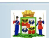
Департамент образования администрации муниципального образования г. Краснодар