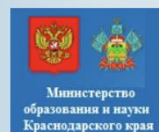
Министерство образования и науки Краснодарского края

Торжественная часть концерта включила в себя выступления барабанщиц «Аркобалено», вокальный номер, стихотворения начальной школы и бессмертного полка, показательные выступления спортивного клуба